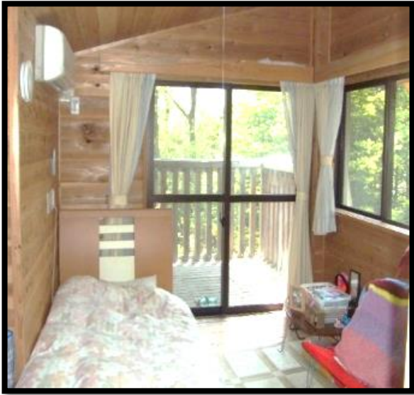
全個室49部屋（レイアウトの1例）