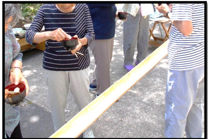
行事（流しそうめん）