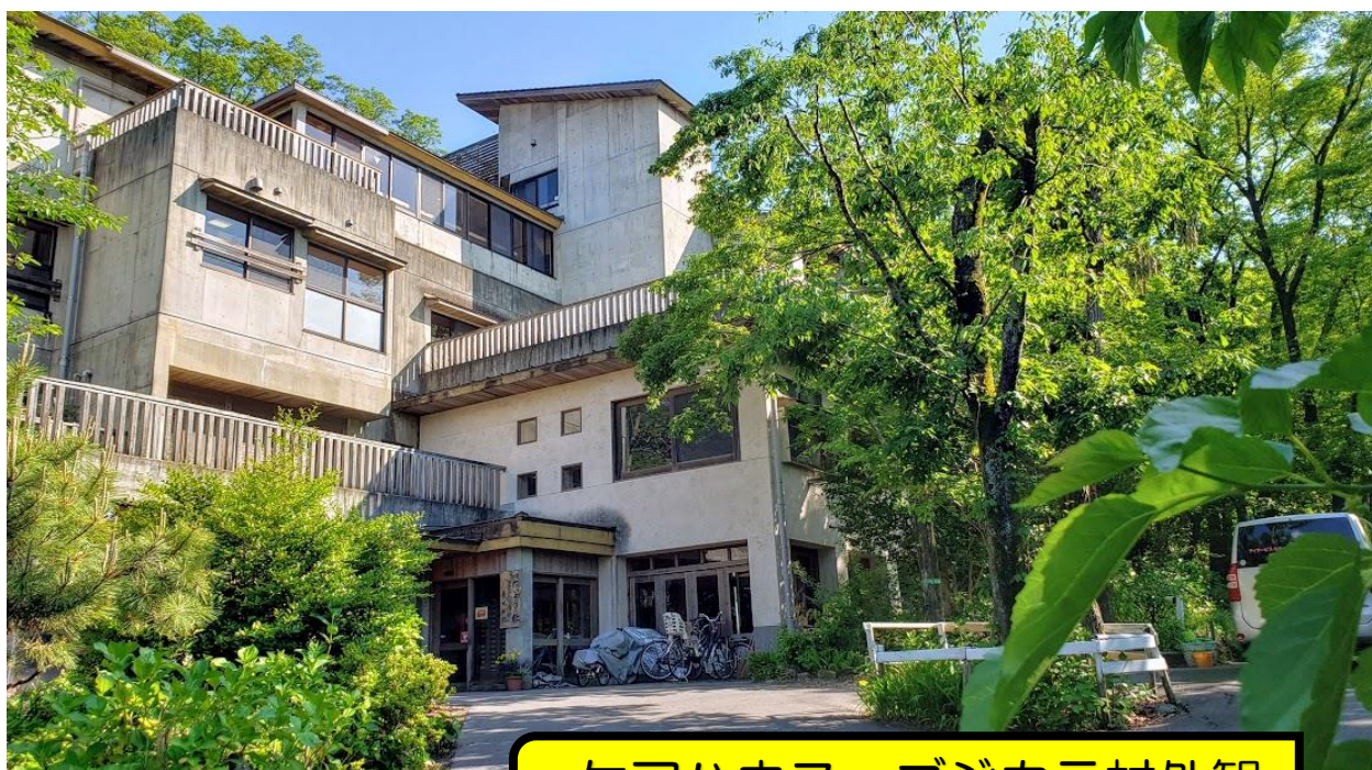
ケアハウス ゴジカラ村外観