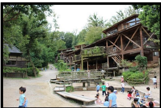
もりの幼稚園（園庭）