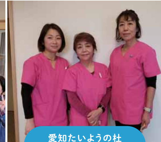
愛知たいようの杜 訪問看護ステーション