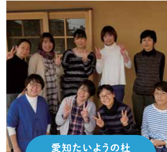
愛知たいようの杜 ケアプランセンター